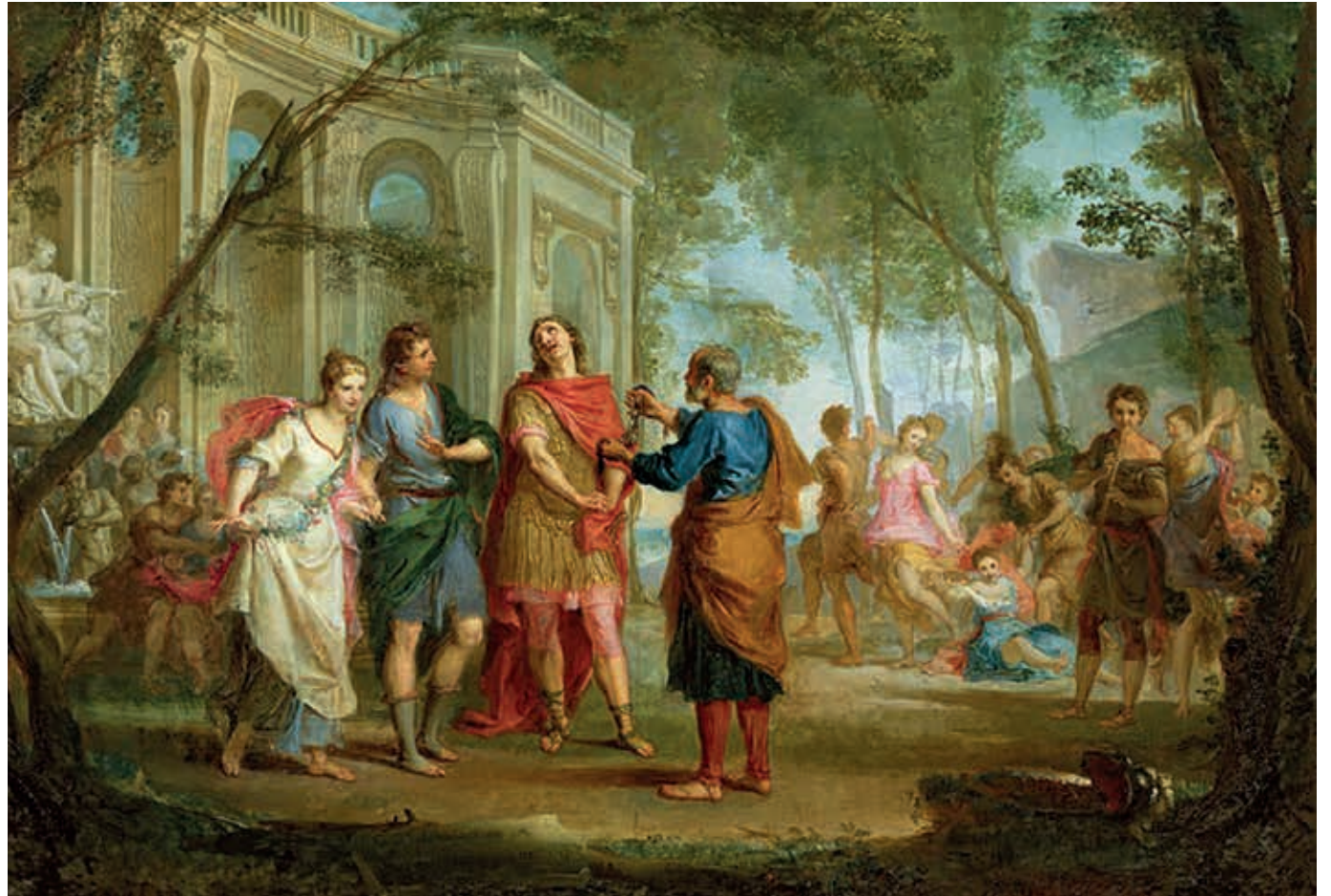
Louis Galloche (1670 - 1761), Orlando scopre l'amore di Angelica e Medora .

Per il suo atteso ritorno su un palcoscenico di prestigio (Milano, Piccolo Teatro Grassi, da venerdì 3 a domenica 5 ottobre), Guido Ceronetti – il grande scrittore che insiste nel volersi de-