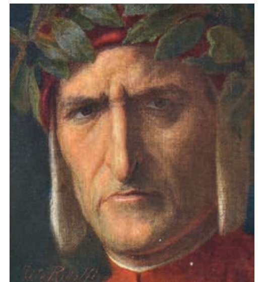
Dante Alighieri poeta, Tito Ridolfi, 1927.

Giulio Leoni, La Sindone del Diavolo , Editrice Nord, 2014, pp. 384, € 14,90 ■