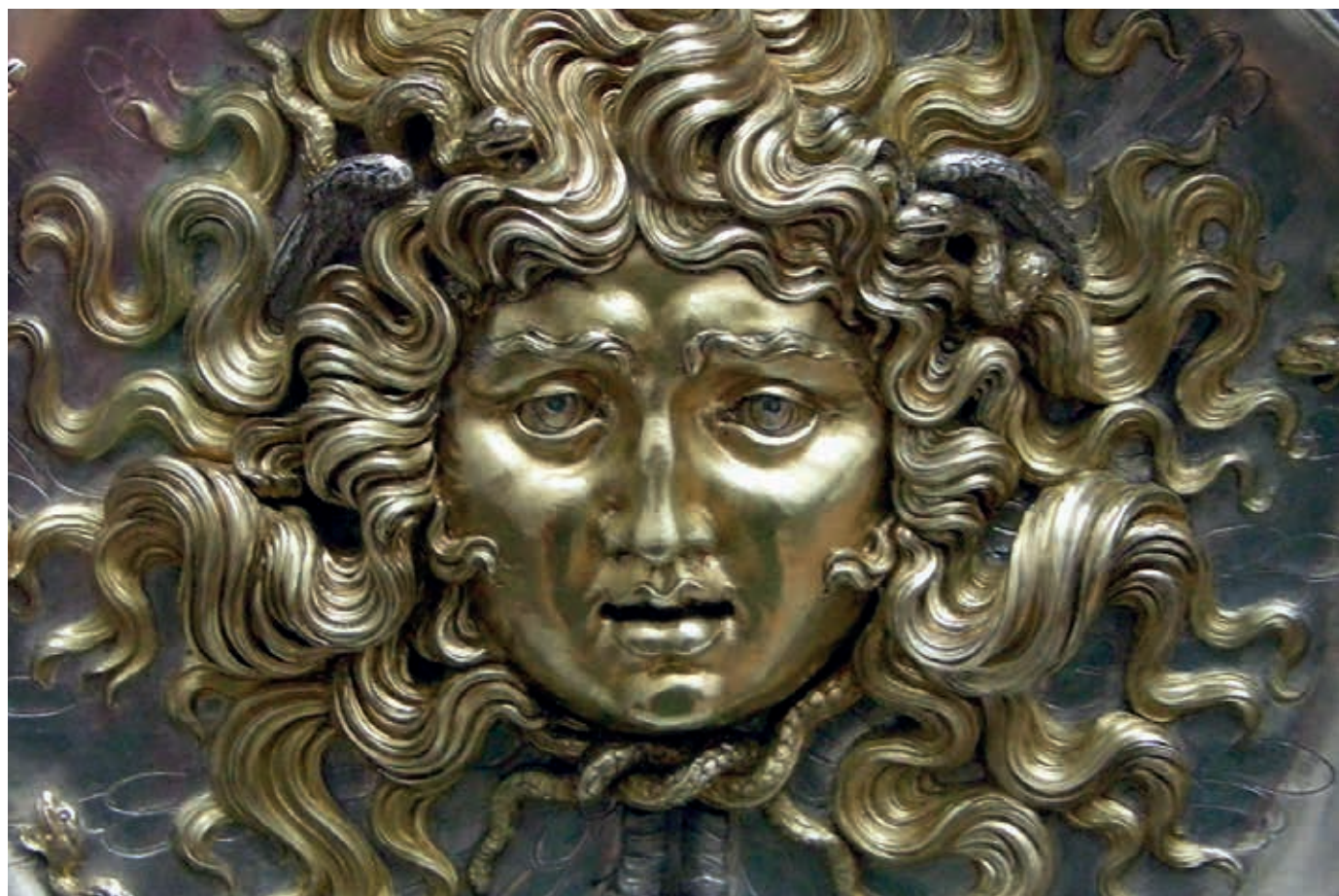
Vincenzo Gemito, Medusa , 1911.