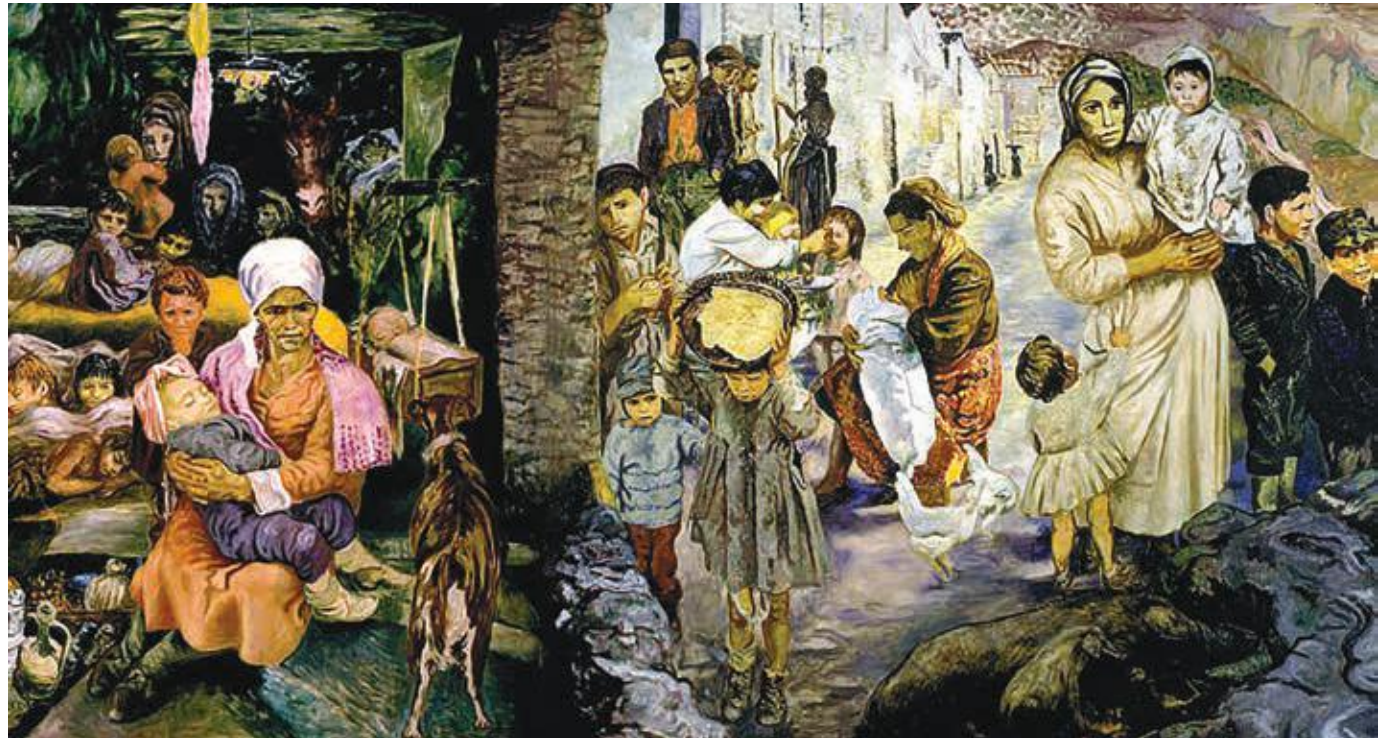
Carlo Levi, Lucania 1961.

figlia, l'ho fatto e per purgare la sua colpevolezza In questo sacrificio ho lavata la mia vergogna