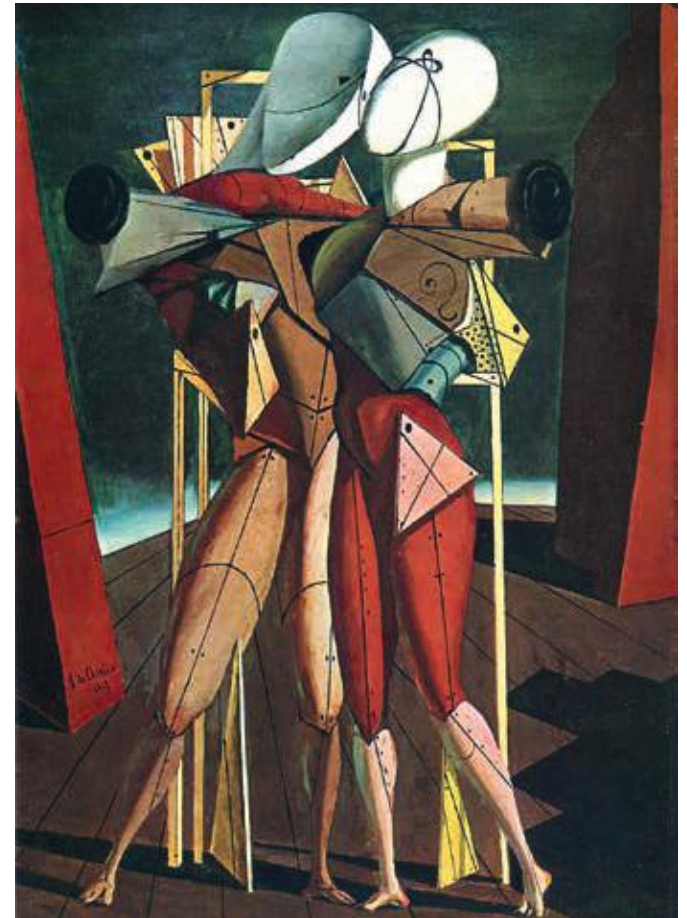
Giorgio De Chirico, a sinistra Gladiatore nell'arena (part.) , 1975; a destra Ettore e Andromaca , 1912.