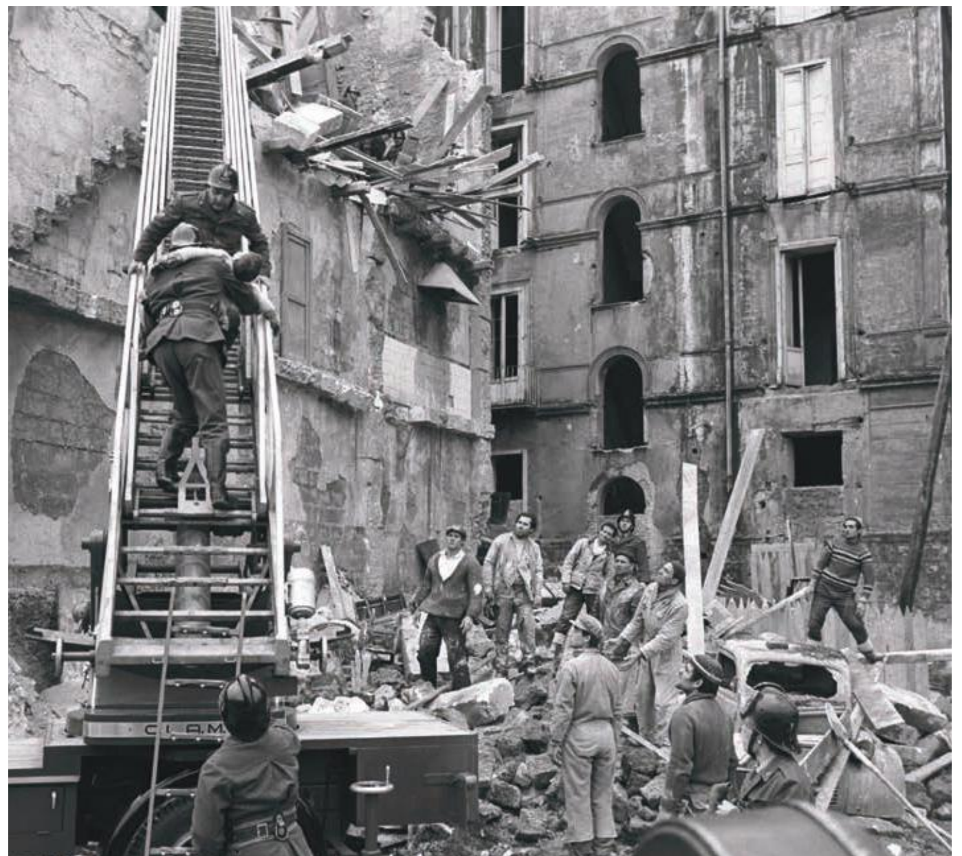
Set del film Le mani sulla città di Francesco Rosi, 1963.