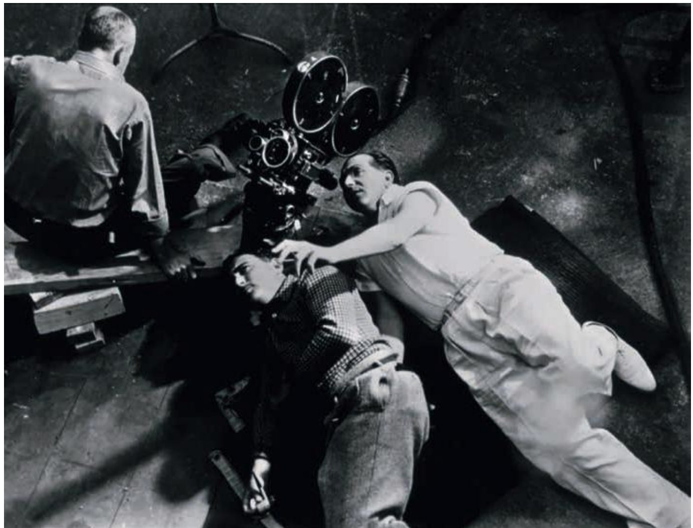
Fritz Lang sul set del film Sono innocente , 1937.

È nel numero di marzo-aprile 1940 di Story che Burnett stabilisce di pubblicare il primo racconto del giovane ventenne che l'ha impressionato per lo stile e per la visione del mondo già matura – tra l'ironico ed il cinico, diciamo, senza dire niente di nuovo –. Il tema del racconto, "The Young Folks" è l'adolescenza. Meglio, l'inquietudine (che tocca tutti) propria del passaggio all'età adulta. Un racconto di iniziazione, nella scia della grande tradizione narrativa nordamericana, da James a Twain ad Hemingway. Giovanotti nel corso di un cocktail party tipicamente newyorkese pensano di affogare nell'alcol la noia e l'angoscia provocata dalla solitudine di ognuno. Sprazzi di conversazione, ma senza un vero senso. C'è un protagonista che